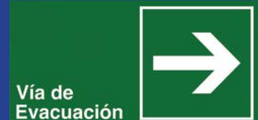
Vía de Evacuación