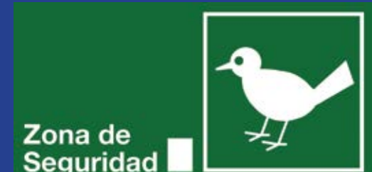
Zona de Seguridad

IMPORTANTE EN CASO DE EMERGENCIA NO GRITES NO CORRAS NO EMPUJES Actúa con calma y prudencia para evitar accidentes.