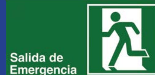
Salida de Emergencia